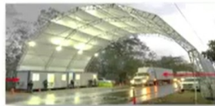
Pajapita, San Marcos 29 de mayo 2020