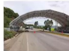
Sanarate, El Progreso Junio 2021