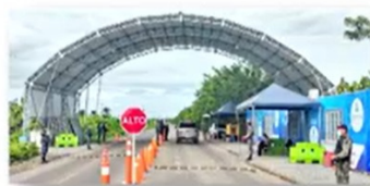
Entre Ríos, Izabal 16 de septiembre de 2020