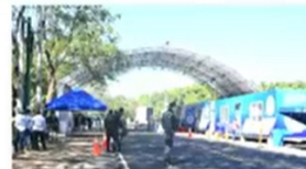
Pasaco, Jutiapa 7 enero 2021