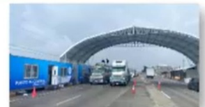
Patzicía, Chimaltenango 19 marzo 2021