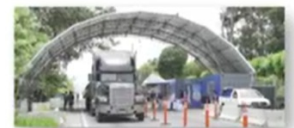
Río Dulce, Izabal 10 septiembre 2021