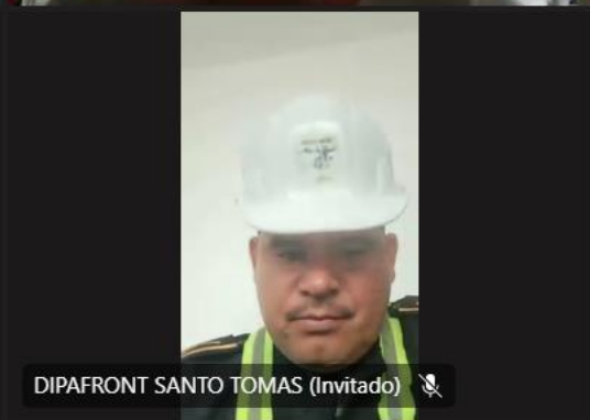
DIPAFRONT SANTO TOMAS (Invitado)